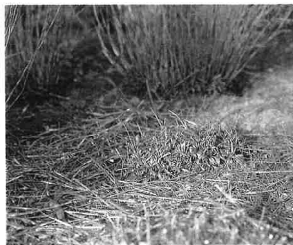
Snoeiafval kan planten beschermen en na vertering weer ten goede komen aan de beplanting.

Vroeger gaven we het snoeiafval gemakkelijk mee in combinatie met het huisvuil of bij grotere hoeveelheden werd het in de tuin verbrand. Verbranden is tegenwoordig om milieutechnische redenen verboden vanwege de schadelijke reststoffen die in de grond achterblijven. Branden is alleen nog toegestaan met vergunning, waarbij de brandplaats aan strenge eisen moet voldoen om schade aan het milieu te voorkomen; en dan